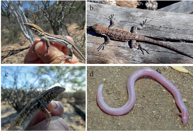
Figura 4. Lagartijas de la EBLAC a) Huico rayado hembra ( Aspidoscelis hyperythrus ), b) Cachora de árbol ( Urosaurus nigricaudus ), c) Cachora común o lagartija de costado manchado ( Uta stansburiana ), d) Ajolotito de dos manos ( Bipes biporus )(PGT)

mayoría de actividad diurna como el colibrí ( Calypte costae ) (Figura 4), el cardenal rojo ( Cardinalis cardinalis ), el pájaro