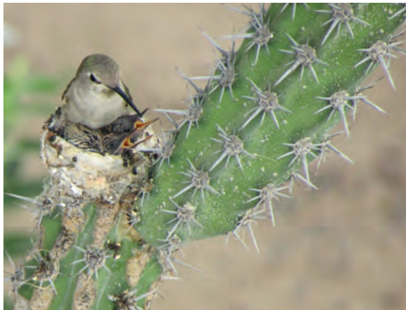
Figura 3. Hembra de colibrí anidando. (PGT)

carpintero ( Melanerpes uropygialis ) entre otras. Entre las nocturnas se encuentran el búho ( Bubo virginianus ) y la lechuza ( Tyto alba ). Destacan las aves consumidoras de semillas (granívoras), entre las que están el gorrion mexicano ( Haemorrhous mexicanus ), la paloma de alas blancas ( Zenaida asiatica ), la huilota ( Zenaida