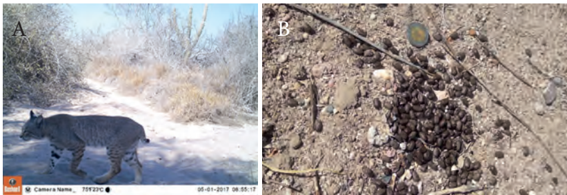
Figura 5. Registros indirectos de las especies. a) Registro con cámara trampa (GAF), b) Excretas de cría de venado bura ( Odocoileus hemionus ) (PGT)

desarrollado investigación sobre microorganismos, plantas, aves, mamíferos y reptiles, relativos a diversos aspectos de su ecología, entre los que destacan los referentes al uso del hábitat, ecología térmica, ecología alimentaria y comportamiento. Esto permite entender las complejas interacciones que se presentan entre las especies de plantas y animales. Aquí queda incluido el estudio del suelo, de las redes tróficas o alimenticias, y cómo pueden verse afectados ante las perturbaciones ambientales, producto de la introducción de especies, actividades humanas y del cambio climático.